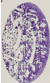
صورة الصفحة الأخيرة من النسخة (ج)